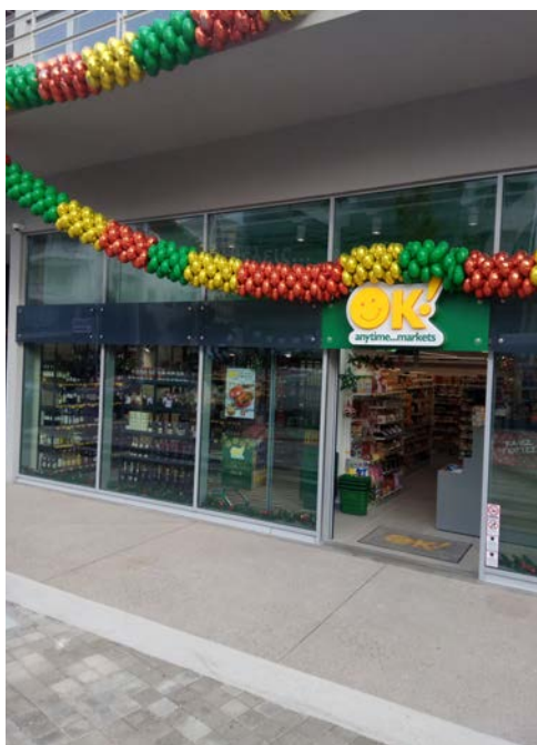
Το κατάστημα της OK! Anytime Markets στο Μαρούσι

Εγκαινιάζουν σήμερα τα OK! Anytime Markets το νέο κατάστημα τους στο Μαρούσι, εντός του εμπορικού συγκροτήματος Green Plaza.