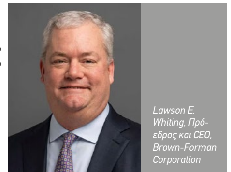
Lawson E. Whiting, Πρόεδρος και CEO, Brown-Forman Corporation

Ο λόγος είναι ότι τα επίπεδα παραγωγής στον συγκεκριμένο κλάδο καθορίζονται αρκετά χρόνια νωρίτερα, λόγω των απαιτήσεων της απόσταξης και της μακρόχρονης διαδικασίας παλαίωσης σε βαρέλια.