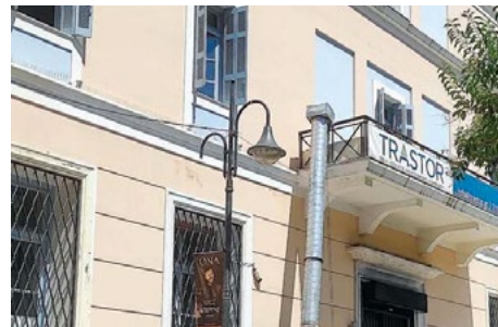
Το κτίριο όπου θα ανοίξει το νέο κατάστημα McDonald's στην Πάτρα

ωθεί ότι επιστρέφουν τα McDonald's στην Πάτρα ύστερα από μια σχεδόν εικοσαετία, και μετά το κατάστημα που λειτουργήσε στα Ψηλαλώνια για περίπου μία διετία. Το δεύτερο θα ανοίξει στο Χαϊδάρι, με τον πήχη της διοίκησης σε εύρος πενταετίας να ανεβαίνει στα 50 καταστήματα στη χώρα μας.