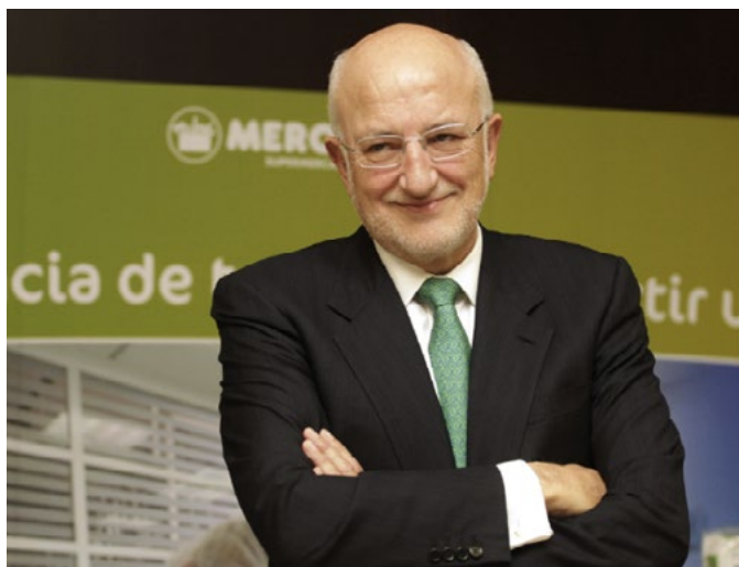
Juan Roig Alfonso, πρόεδρος, Mercadona (Πορτογαλία)

Στην Πορτογαλία, η Mercadona άνοιξε 11 καταστήματα το 2024, φτάνοντας τα 60, ενώ σχεδιάζει να ανοίξει άλλα 12 το 2025. Σημειώνεται ότι στη χώρα έχει ήδη εγκαταστήσει και ένα νέο κέντρο logistics στο Almeirim.