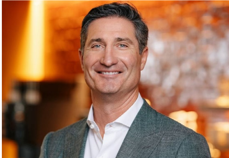
Brian Niccol, CEO, Starbucks

Η εξέταση εναλλακτικών για την Ιαπωνία έρχεται λίγους μήνες μετά τη συμφωνία της Starbucks με την Boyu Capital για την πώληση του ελέγχου των δραστηριοτήτων της