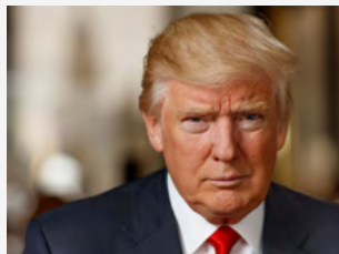
Donald Trump, Πρόεδρος ΗΠΑ

Τα μέτρα είχαν σχεδιαστεί ώστε να ενισχύσουν τη βραχυπρόθεσμη προσφορά βοδινού στην αμερικανική αγορά, κυρίως μέσω αύξησης των εισαγωγών, αλλά και μέσω παρεμβάσεων για την αποκατάσταση του εγχώριου ζωικού κεφαλαίου. Ωστόσο, η υλοποίησή τους μετατέθηκε προσωρινά, καθώς η κυ-