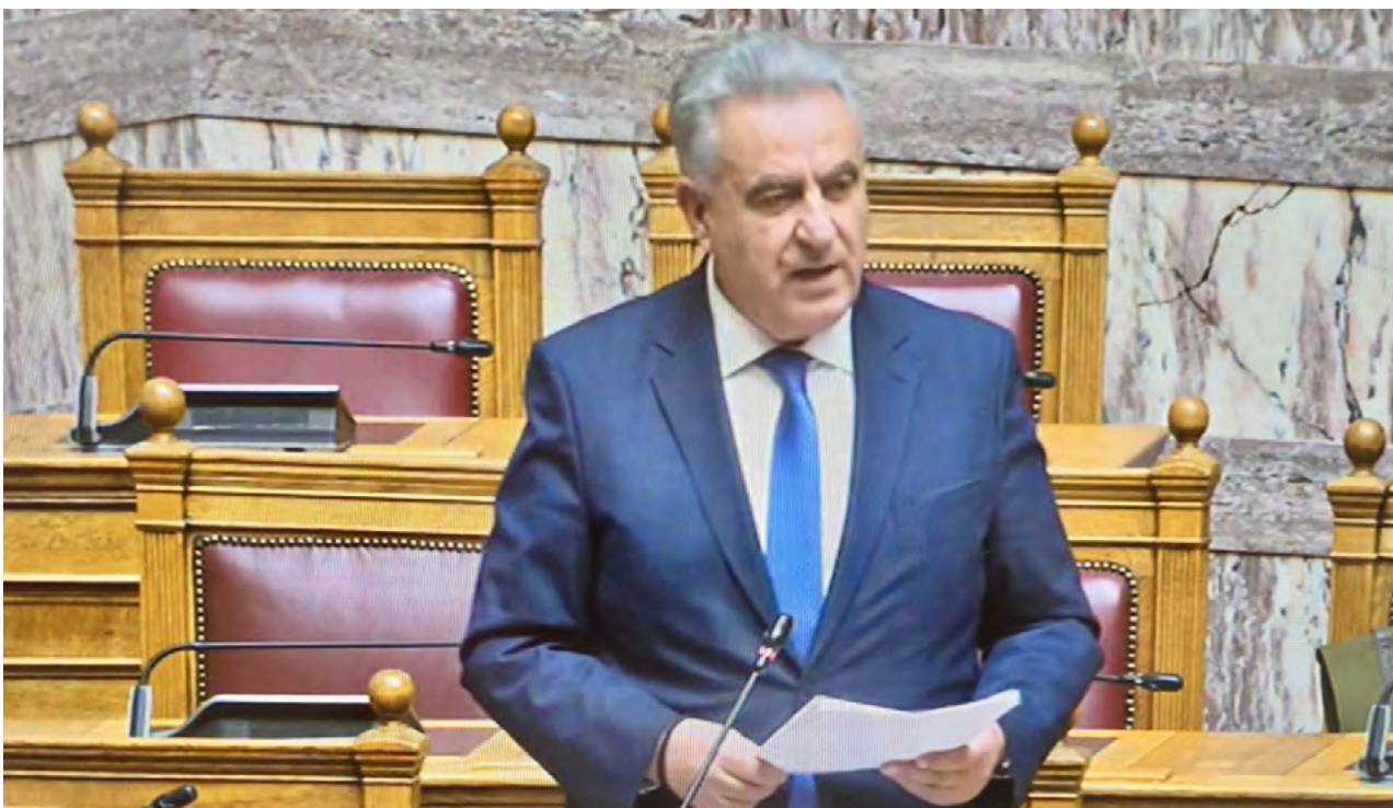
Αθανάσιος Καββαδάς, Υφυπουργός Αγροτικής Ανάπτυξης και Τροφίμων

Όπως εξήγησε, σε αντίθεση με την περίπτωση της Λέσβου και του αφθώδους πυρετού, όπου υπήρξαν περιορισμοί στη διάθεση προϊόντων και αναστολές δραστηριότητας, στην Ανατολική Μακεδονία και Θράκη δεν επιβλήθηκε διακοπή λειτουργίας ή απαγόρευση εμπορίας για τα τυροκομεία, γεγονός που δεν επιτρέπει –με βάση τους ευρωπαϊκούς κανόνες– τη χορήγηση αντίστοιχων κρατικών ενισχύσεων.